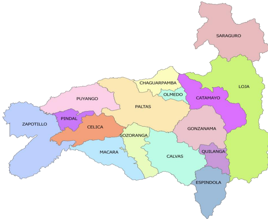
Mapa 1. Distribución Política - Administrativa

Fuente: Planifica Ecuador – Kit de información provincia de Loja 2019 Elaboración: GPL - DPT, 2019