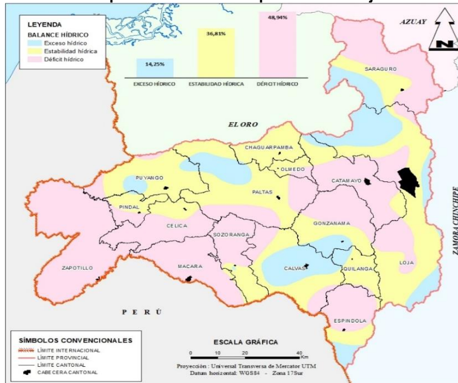
Mapa 2. Déficit hídrico / provincia de Loja